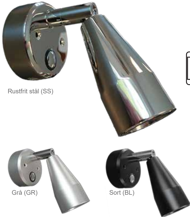
Rustfrit stål (SS)